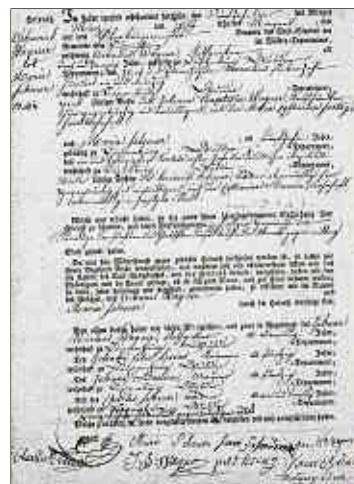
Viele Akten sind in alter, deutscher Spitzschrift verfasst.